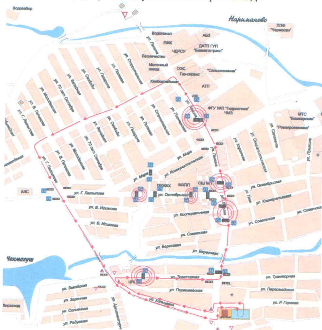
Схема №3 учебного маршрута движения транспортных средств Местного отделения ДОСААФ Чекмагушевского района РБ категории «С на Д»