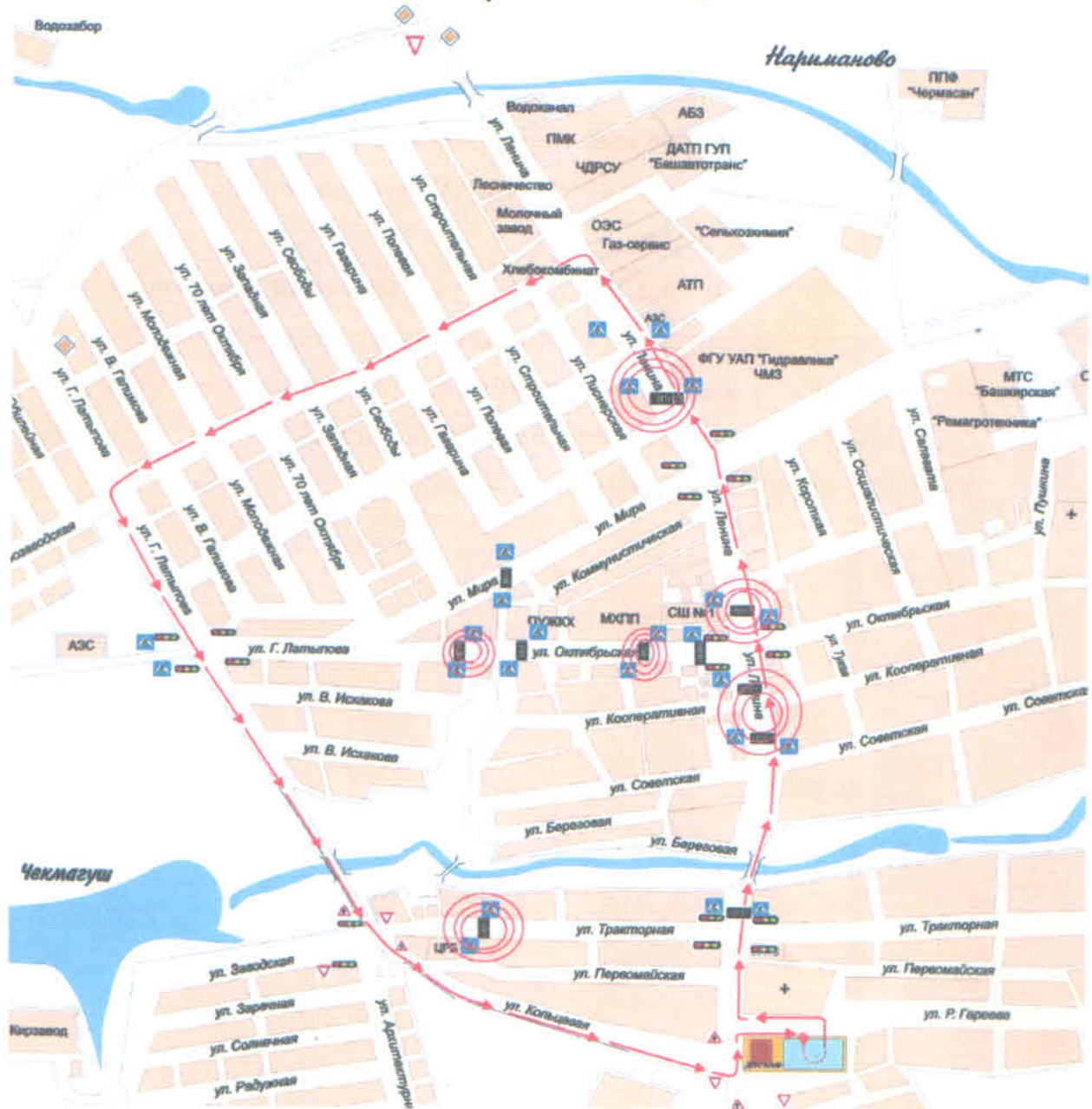
Схема №1 учебного маршрута движения транспортных средств Местного отделения ДОСААФ Чекмагушевского района РБ категории «С на Д»