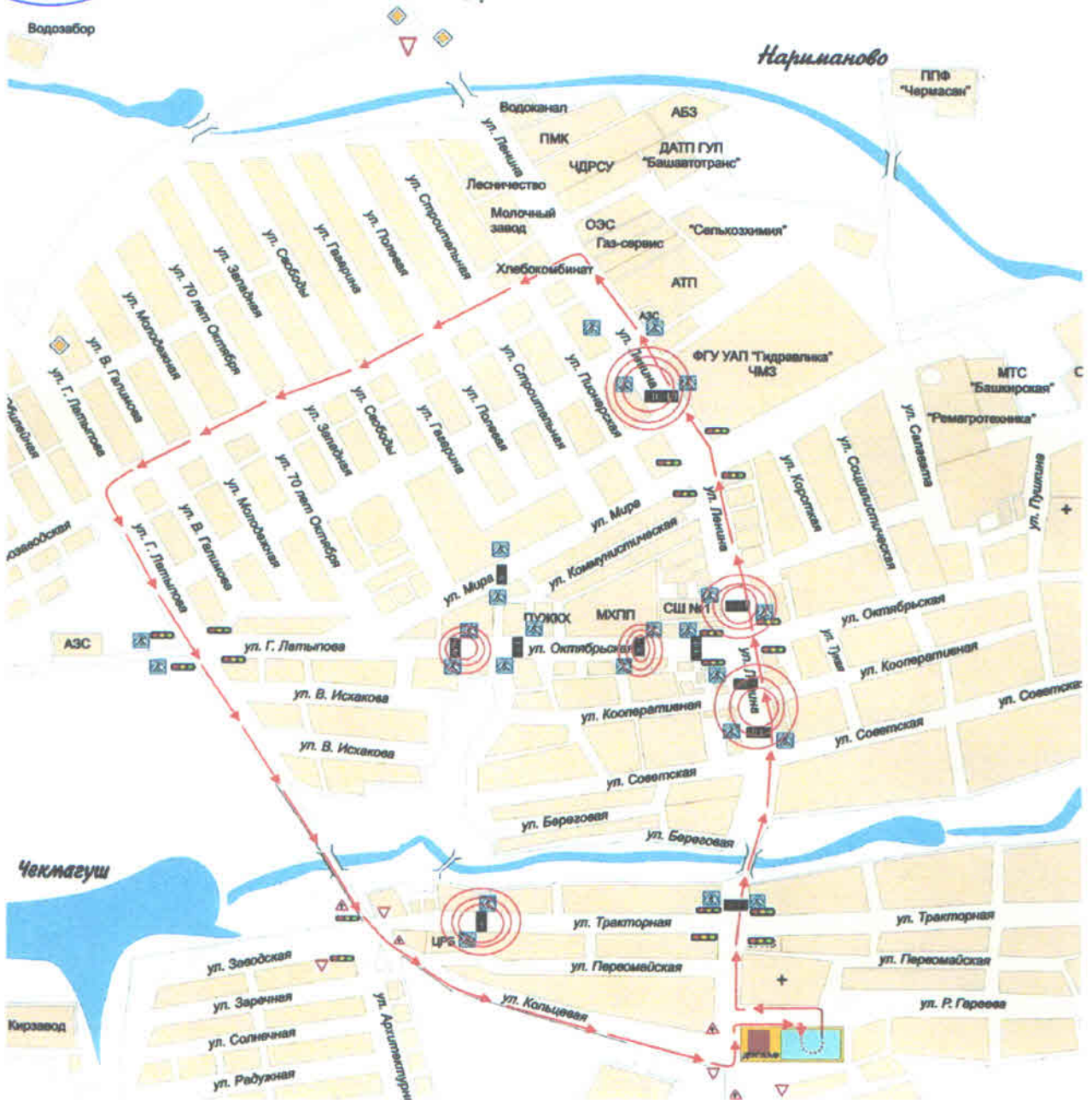
Схема №1 учебного маршрута движения транспортных средств Местного отделения ДОСААФ Чекмагушевского района РБ категории «В на Д»